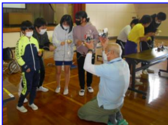
【エネルギー教育講座 6年生】

中部電力の方に御協力いただき、発電の仕組みや特徴について学習し、各種発電がどの環境に適しているか考えました。